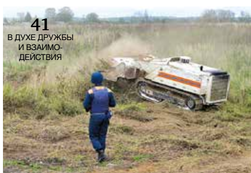
41 В ДУХЕ ДРУЖБЫ И ВЗАИМО- ДЕЙСТВИЯ