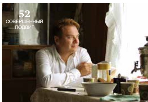
52 СОВЕРШЕННЫЙ ПОДВИГ