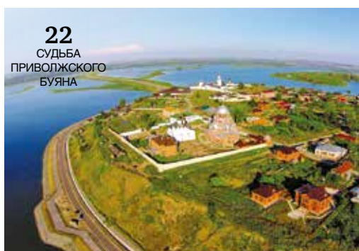
22 СУДЬБА ПРИВОЛЖСКОГО БУЯНА

Вековые традиции и новейшие технологии, культурное наследие и стратегический потенциал, научно-производственные гиганты и природно-архитектурные комплексы... Учебные заведения министерства... Уникальные объекты страны под защитой лучших пожарно-спасательных подразделений МЧС России... В каждом номере журнала «Пожарное дело».