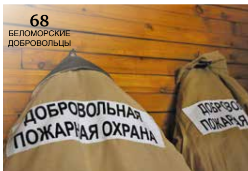
68 БЕЛОМОРСКИЕ ДОБРОВОЛЬЦЫ