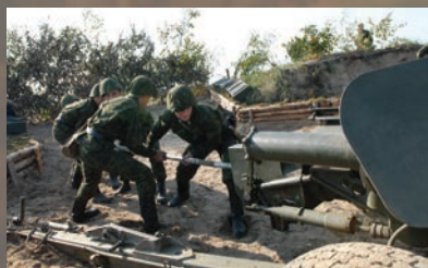
РАЗВИТИЕ ТАКТИКИ НАСТУПАТЕЛЬНОГО БОЯ