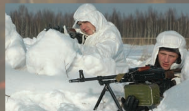
ОТРАЖАЯ КОНТРАТАКУ ПРОТИВНИКА