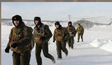
ПОД ПОКРОВОМ ПОЛЯРНОЙ НОЧИ