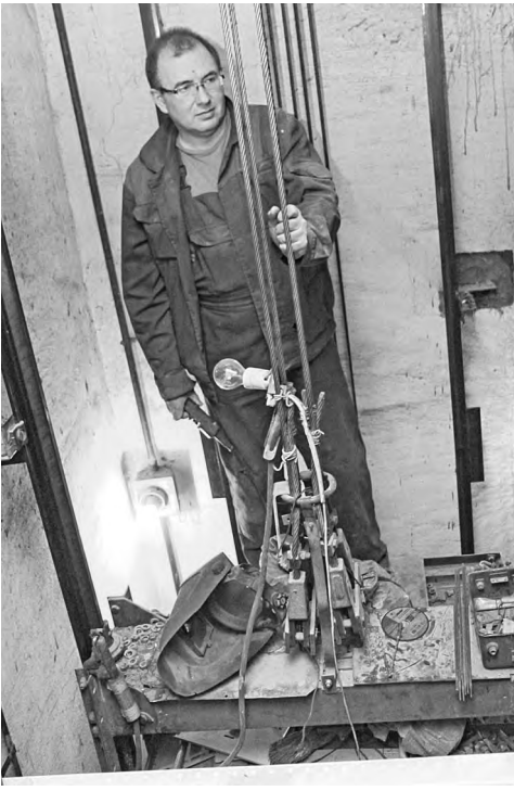
Чтобы УК могла эксплуатировать новые лифты, ее сотрудники должны пройти специальную аттестацию.

Напомним, «РГ» уже сообщала о том, что на декабрь 2017 года в Заполярье около 70 процентов лифтов были признаны отслужившими свой срок и требовали капитального ремонта или замены. Если учесть, что всего в жилых домах Мурманской области действуют 3045 лифтов, заменить необходимо около двух тысяч