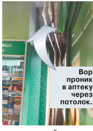
Вор проник в аптеку через потолок. пострадавший уже в машине «скорой». Как стало известно «МК», родом он из Костромы и ранее уже был судим за кражу.

Поккупатели магазина к этому времени уже вызвали на место полицейских и медиков. Умер