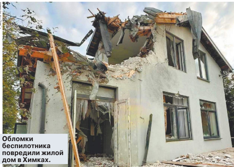
Обломки беспилотника повредили жилой дом в Химках.