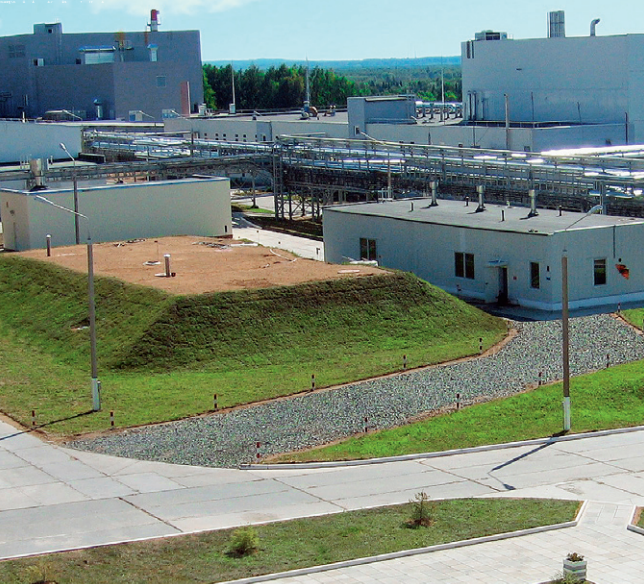
Промышленная безопасность на взрывоопасных и химически опасных производственных объектах