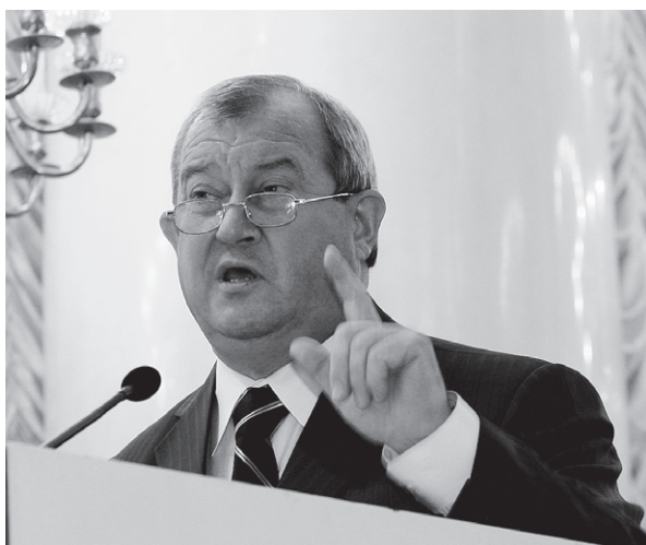
Единая система соответствия