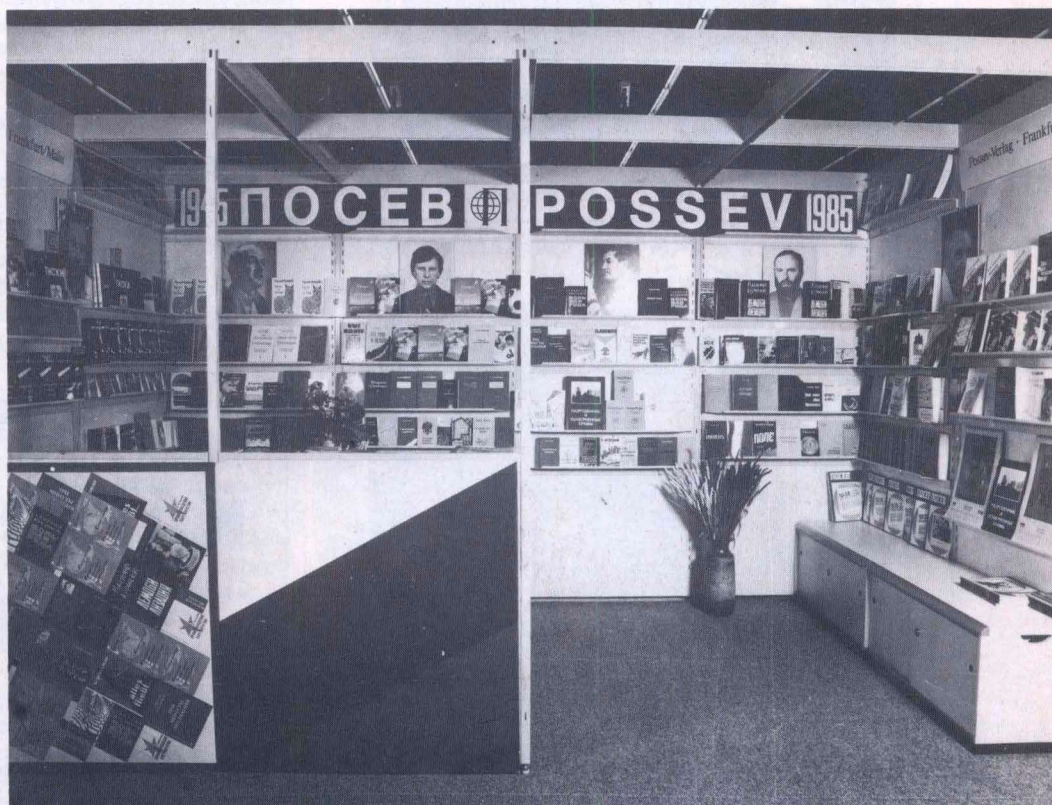
Стенд издательства «Посев» на Международной книжной ярмарке 1985 г. во Франкфурте-на-Майне

ЕЖЕМЕСЯЧНЫЙ ОБЩЕСТВЕННО-ПОЛИТИЧЕСКИЙ ЖУРНАЛ