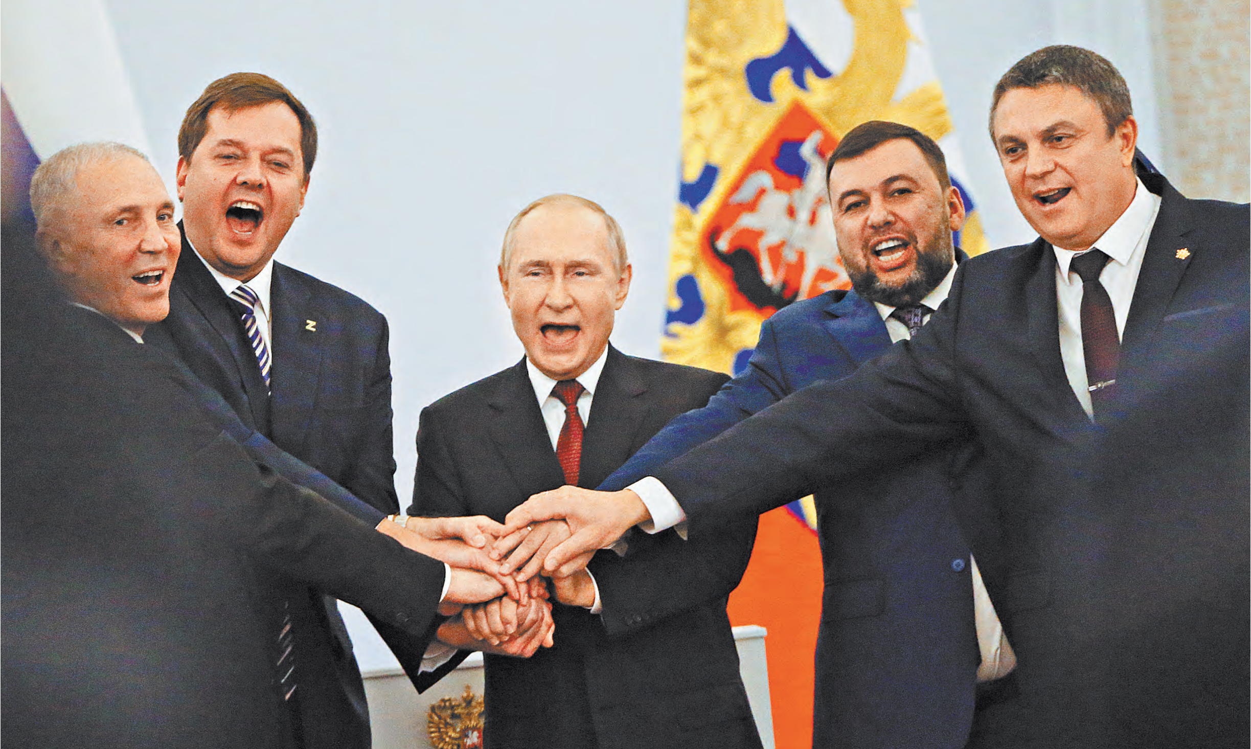
Владимир Путин, Евгений Балицкий, Владимир Сальдо, Денис Пушилин и Леонид Пасечник после подписания документов скрестили руки и скандировали: «Россия!».

Глава государства подчеркнул, что сегодня идет сражение за то, чтобы никому и никогда не пришло в голову, что Россия, русский язык, русскую культуру можно взять и вычеркнуть из истории. Россия всегда будет помнить героев Русской весны, которые погибли за право говорить на родном языке, сохранять свою культуру и веру, заявил президент.