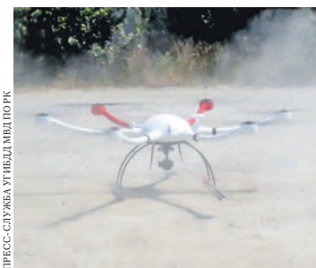
Коптер оборудован аппаратно-программным комплексом «Шмель».