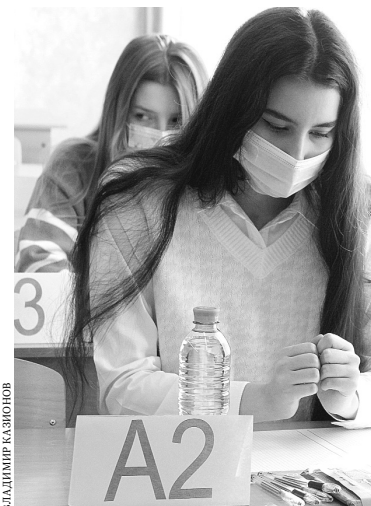
На досрочный этап ЕГЭ в Омской области пришло около ста человек.

Эксперты регионального министерства образования отмечают, что омичи нередко приходят за вторым, а то и третьим высшим образованием. Сегодня возраст не является помехой для того, чтобы начать все заново.