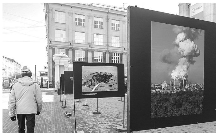
Последствия атак на города Донбасса на Западе не замечали восемь лет.

Сочетание реалий войны и мирной жизни поражает.