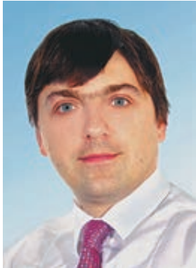
Вот и Сергей Кравцов обвинен в плагиате.

Позорище, конечно. Можно, бесспорно, смаковать, как вор у вора дубинку унес. А можно просто дать совет всем чиновникам, собравшимся на повышение: забудьте вы о своих степенях, сотрите золото с визитных карточек. Целее будет! ■