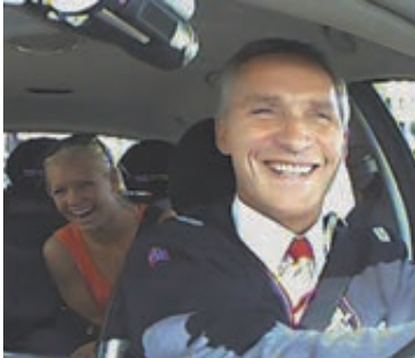
Премьер Норвегии в роли таксиста.