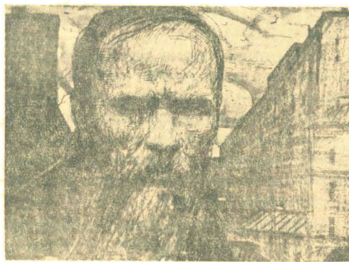
И. Глазунов. Достоевский.

ва в покое, хотя он и не скомпрометировал себя в ее глазах политически. Но все его творчество, насквозь пронизанное духом русскости, не может не действовать на сознание и чувства народа, и особенно молодежи, как колокол, зовущий в ночной пурге к теплу и свету сбившегося с дороги путника.