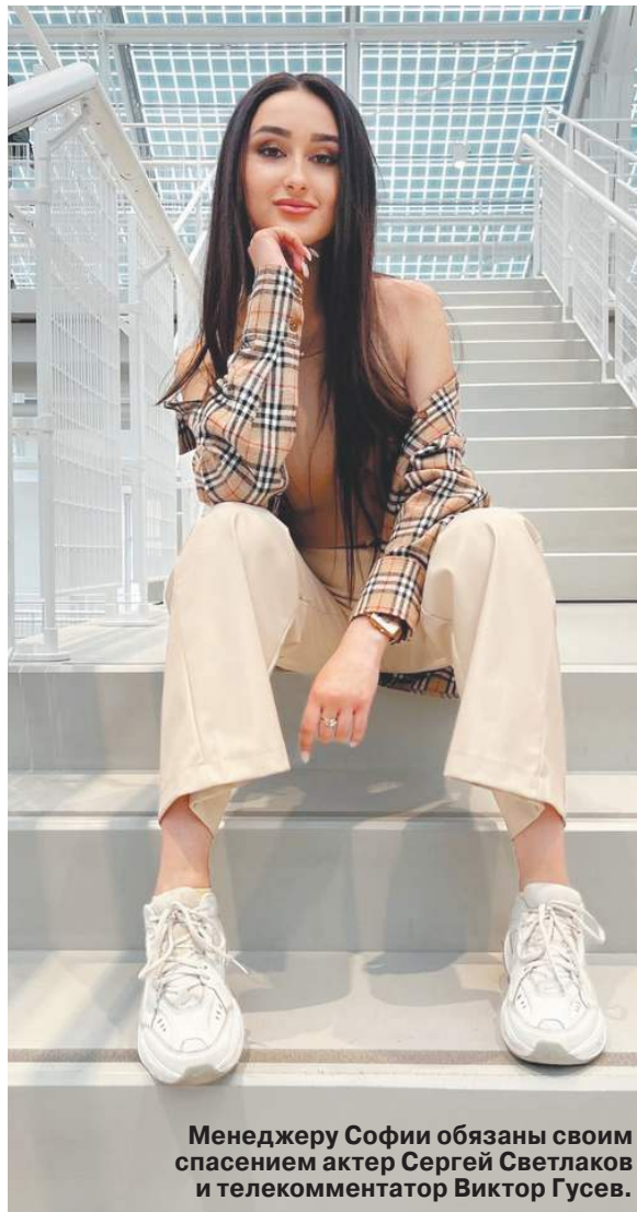
Менеджеру Софии обязаны своим спасением актер Сергей Светлаков и телекомментатор Виктор Гусев.