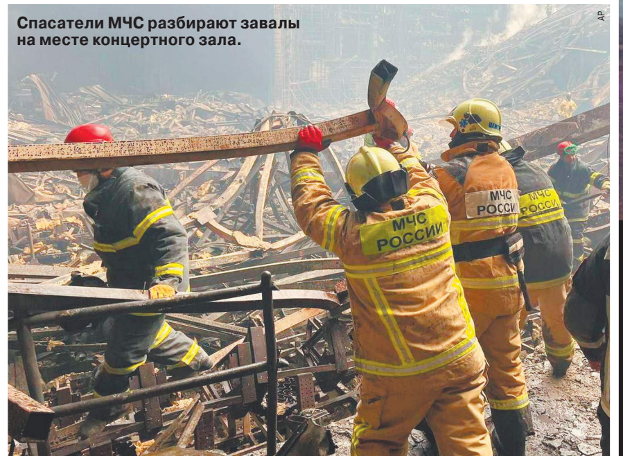
Спасатели МЧС разбирают завалы на месте концертного зала.

как можно больше народу. И их дьявольский план сработал: те, кто не был застрелен за 18 минут (столько длилось нападение) и не успел сбежать, погибли в устроенном террористами пожаре. 24 марта в России было днем траура. В ближайшие дни пройдут похороны погибших. А дальше нам снова придется учиться жить. И не просто жить, а противостоять абсолютному злу, которое проникло в наш дом. Хроника страшного теракта — в материале репортеров «МК».