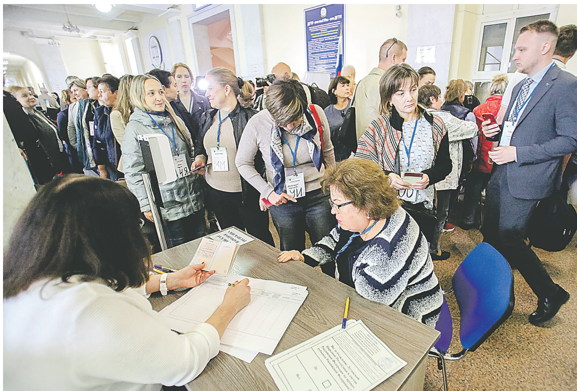
На референдуме жители освобожденных территорий поздравляли друг друга, обменивались новостями и планами на будущее.