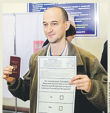
Люди не скрывали радости, проголосовав на референдуме.

За тем, как проходит референдум в Ростовской области, следили наблюдатели из ЮАР, Венесуэлы и Того. Они отметили высокий уровень организации.