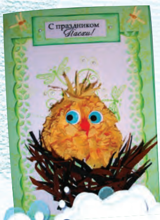
Открытка «С праздником Пасхи!»