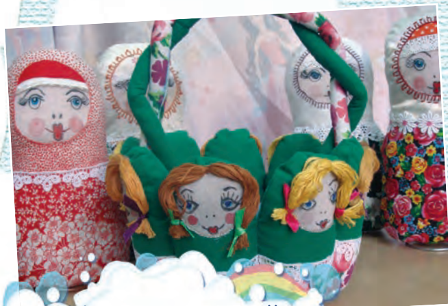
Национальный символ России