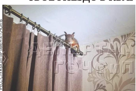
ПРЕСЛАВАЯ БЕЛКА НАЧАЛА СВИТЬ ГНЕЗДО НА ПОДЪЕЗДЕ

Белка, проникшая в квартиру в московском районе Кузьминки 24 апреля, занялась обустройством гнезда. Зверек напугал хозяев, они вызвали спасателей.