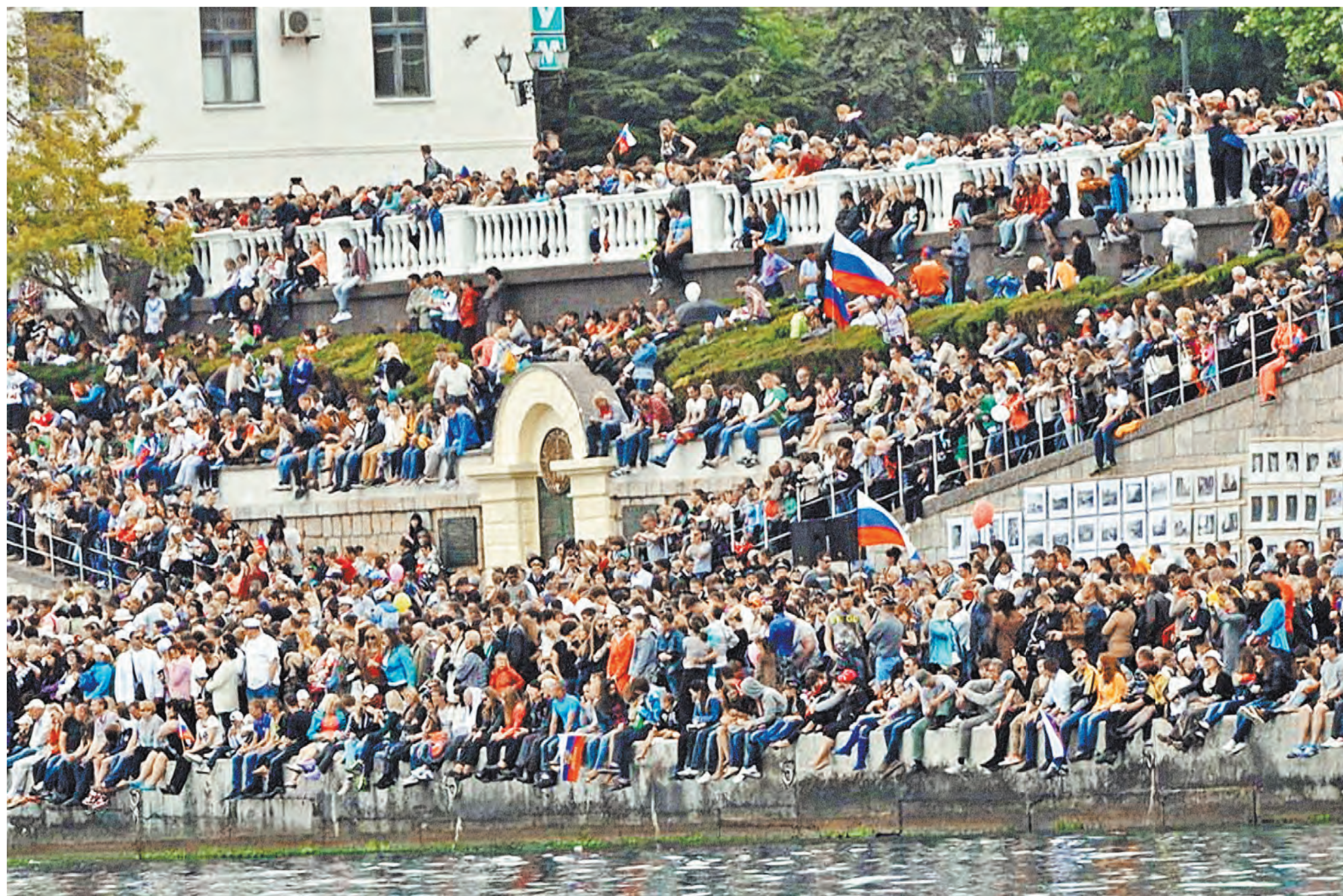
Весь Севастополь пришел на праздник, люди скандировали «Россия!» и благодарили Владимира Путина за счастье вернуться домой, в Россию.

Такого счастливого, со слезами на глазах праздника в Севастополе не было с 1945 года