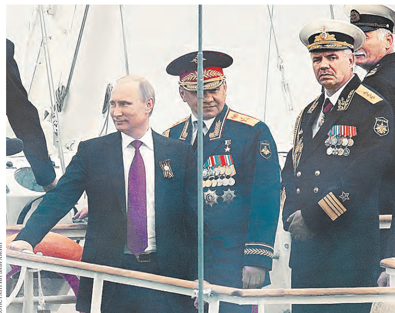
Президент на катере обошел строй боевых кораблей Черноморского флота.

Наконец настала тишина, и Путин продолжил: «С уважением относимся к тому, как вы через годы и поколения пронесли любовь к Отечеству. Но и Родина-мать открыла вам свои объятия и приняла своих дочерей и сыновей». Подчеркнув, что Россия уважает законные интересы всех стран и народов, он призвал, чтобы и «к нашим интересам так же относились, включая восстановление исторической справедливости и право на самоопределение». «Многое сделано, но предстоит еще больше: нам нужно восстановить экономику, поднять жизненный уровень людей», — подчеркнул президент. «Это непростая задача, но я уверен, что мы все это сделаем, потому что мы вместе», — произнес он. «Обнимаю вас, дорогие мои! С праздником!» — заключил Путин.