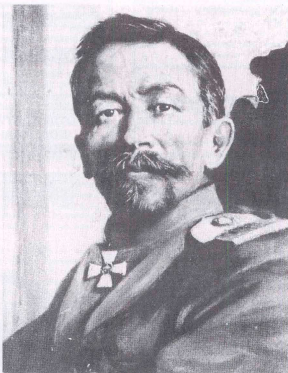
Генерал Л.Г. КОРНИЛОВ

ЕЖЕМЕСЯЧНЫЙ ОБЩЕСТВЕННО-ПОЛИТИЧЕСКИЙ ЖУРНАЛ