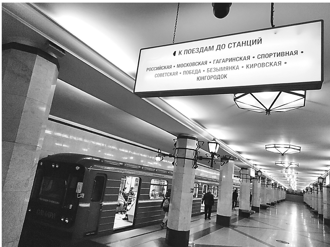
СХЕМА САМАРСКОГО МЕТРОПОЛИТЕНА

В Самаре начато строительство новой станции, завершающей первую ветку метро