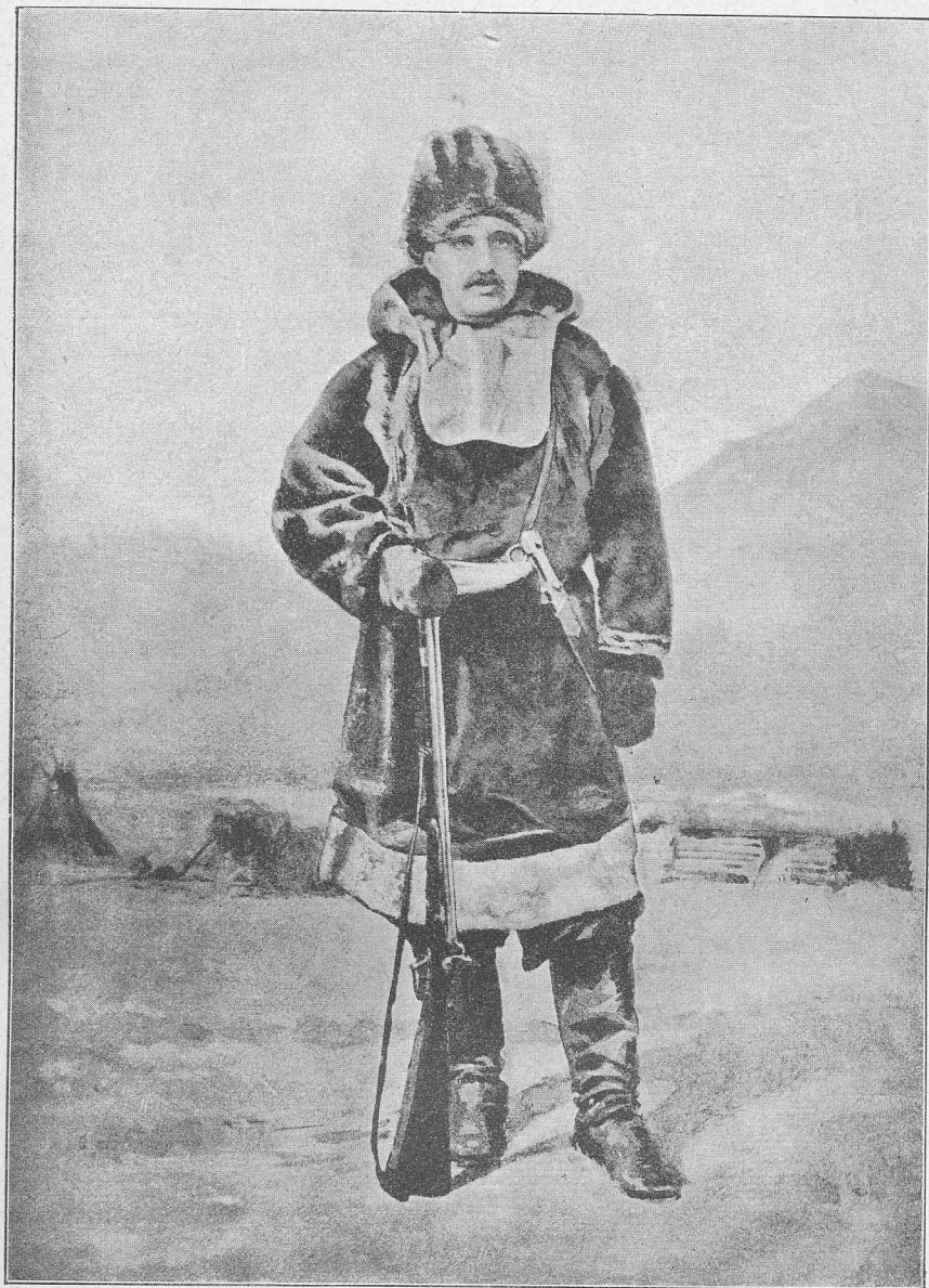
Н. М. Пржевальскій.