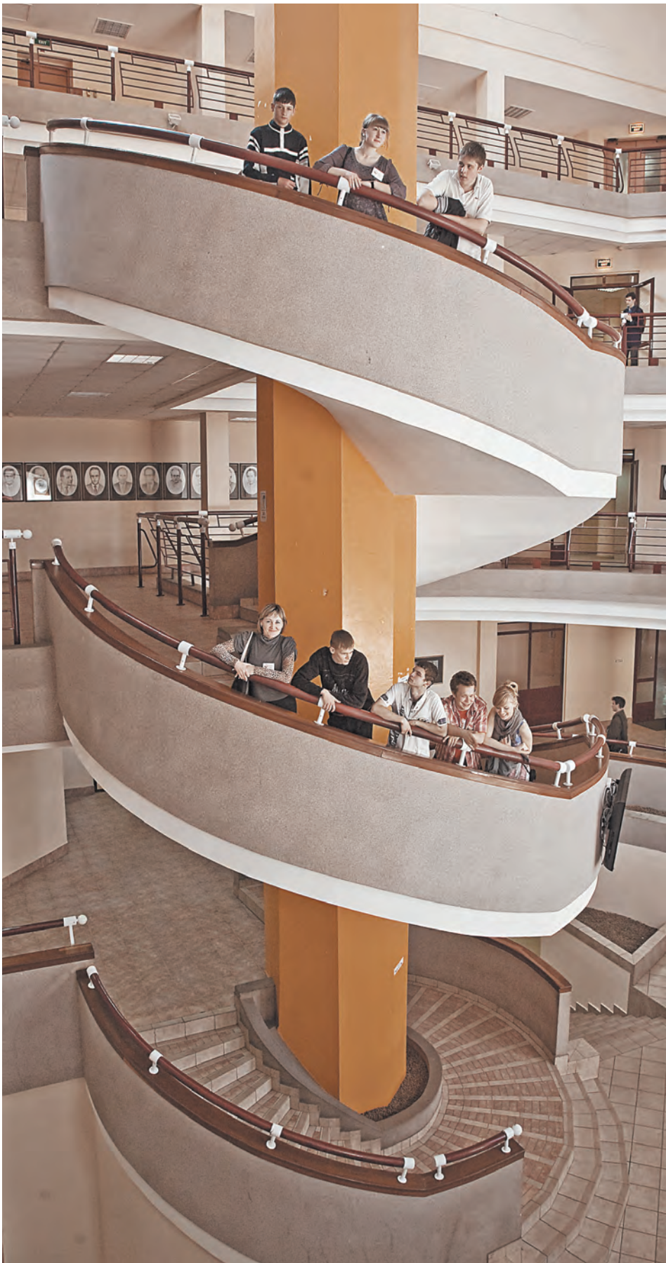
Отдельный разговор на форуме предполагается посвятить молодежной политике.

«Мы рассматриваем вопросы межрегиональных связей прежде всего. Нас интересует более глубокая интеграция наших регионов в рамках Союзного государства», — заявил «СОЮЗу» зампред Совета Федерации Юрий Воробьев. — Мы рассчитываем, что на форуме будут найдены новые пути сближения в социальной, культурной, научной деятельности наших государств. Конечно, проблемы всегда существуют, их надо решать. И на форуме мы их более четко увидим и поймем, на чем надо сосредоточиться».