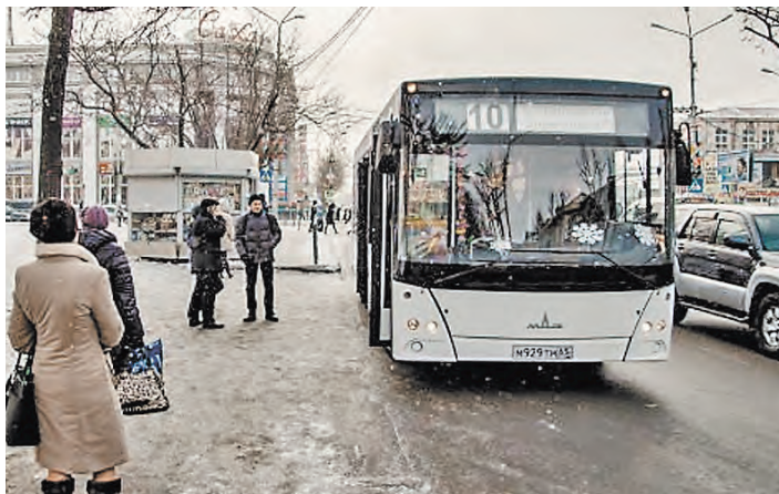
Производители МАЗов делают ставку на комфорт, выносливость и экологичность.

В 2015 году Минский автозавод поставил в Россию 522 автобуса разных моделей, заняв 4-е место среди поставщиков аналогичной продукции. Так, 38 городских автобусов было направлено в Ростов-на-Дону, 28 — в Норильск, 80 — в Санкт-Петербург. А в Екатеринбург поставлено 58 автобусов, работающих на экологически более безопасном природном газе.