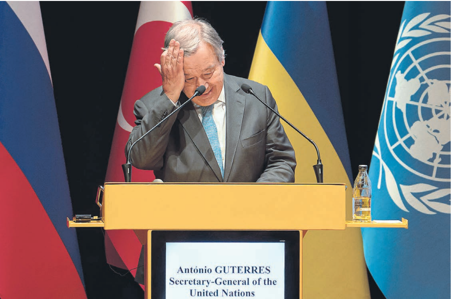
Посетивший Украину генсек ООН Антониу Гутерриш не только словами, но и всем своим видом давал понять, что в ближайшем будущем мира там ждать не стоит

Контакты эти, говорят собеседники „Ъ“ в ООН, выглядят своеобразно. Напрямую