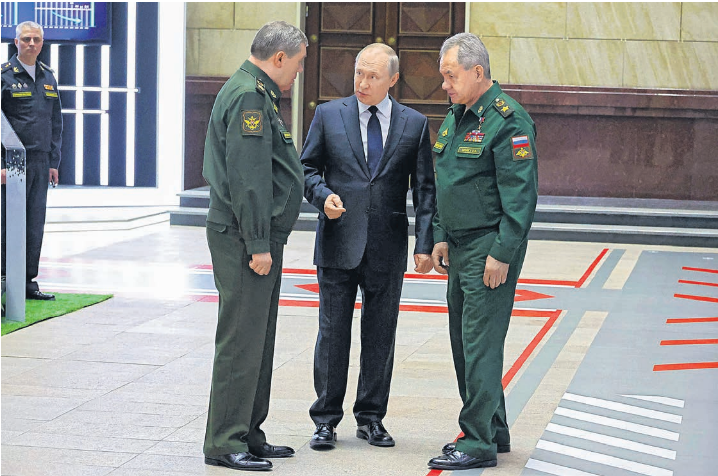
Верховный главнокомандующий (в центре), начальник Генштаба (слева) и министр обороны (справа) перед совещанием. Четвертый (в верхнем левом углу) — лишний

— Вместе с тем боевые действия, безусловно, обозначили и вопросы, над которыми мы, как в таких случаях говорят, должны особо поработать. В том числе те, которые мы не раз обсуждали. Имею в виду связь (связисты попали сразу в оба списка, как и артиллеристы. — А. К.), автоматизированные системы управления войсками и оружием,