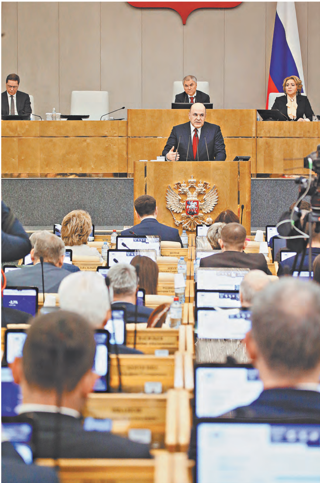
Михаил Мишустин рассказал депутатам, как правительство удержало экономику и социальную сферу.

Комплекс мер позволил справиться с инфляцией. «Сейчас мы наблюдаем ее приближение к целевому уровню», —