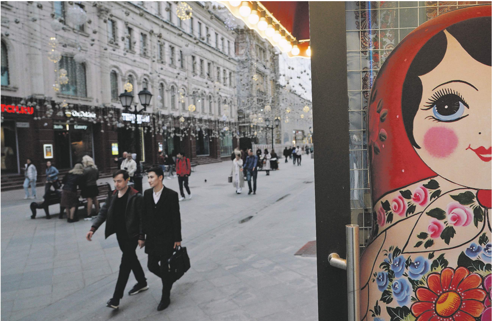
Ксения Корнилова / Иллюстрация