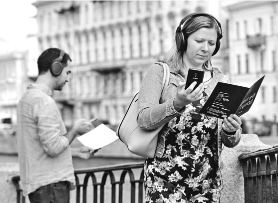
Пешеходы часто подвергают себя опасности.

Знаки «Без наушников. Без телефона. Без капюшона», напоминающие горожанам о необходимости при переходе дороги сфокусировать свое внимание на пути и движущихся автомобилях, появились на пешеходных переходах Северной столицы. Соответствующий пилотный проект в преддверии летних каникул стартовал в Петербурге. Всего в его рамках планируется оборудовать 10 пешеходных переходов.