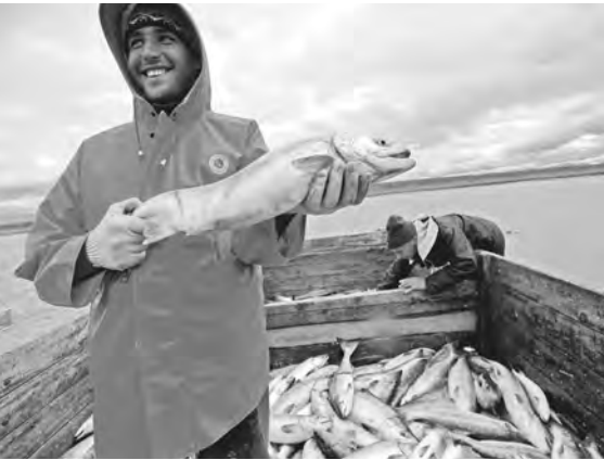
Лосось — одна из самых популярных пород рыб у россиян.

В Архангельске начали испытания первой партии рыбных кормов для аквакультуры — они разработаны в научно-образовательном центре «Российская Арктика». Северные ученые начали создавать собственную рецептуру с использованием местного сырья еще в 2021 году, поэтому «новую еду» для живущих в неволе лососей удалось создать так быстро. Первые результаты тестов будут известны в мае. Далее состав корма подкорректируют с учетом отзывов рыбодоводов — они сейчас наблюдают, как на новую еду реагирует кишечник лососевых, как рыба набирает вес. Производственный цех создан на базе Северного (Арктического) федерального университета. Аналогов подобных технологических площадок в России пока нет. Бюджет проекта составил 4,5 миллиона рублей. Финансируется он по нацпроекту «Наука и университеты», средства выделяются также из региональной казны.