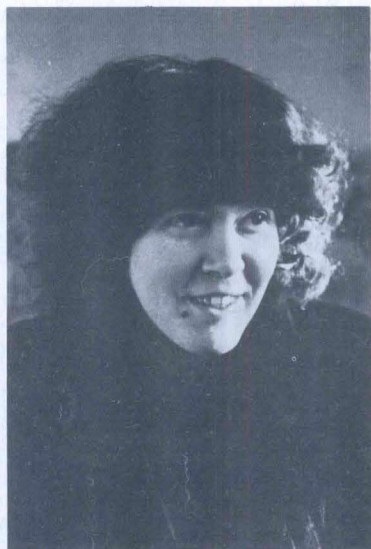
Ирина Георгиевна Ратушинская

Осуждена на 7 лет лагерей и 5 лет ссылки