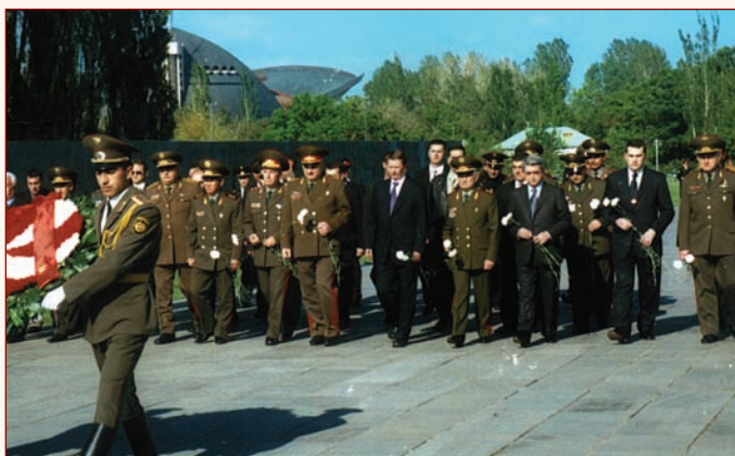
▲ Участники заседания СМО СНГ возлагают венки к мемориалу в г. Ереване Май 2005 г.