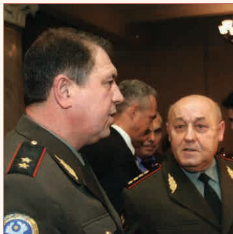
Председатель КНШ ВС ГУ СНГ, начальник Генерального штаба ВС РФ генерал армии Ю.Н. Балуевский (справа) и секретарь Совета министров обороны СНГ генерал-лейтенант А.С. Синайский 2 ноября 2006 г.