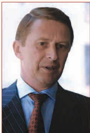
▲ Председатель Совета министров обороны Содружества Независимых Государств, заместитель Председателя Правительства — министр обороны Российской Федерации С.Б. ИВАНОВ

14 ФЕВРАЛЯ 1992 года решением глав государств, входящих в СНГ, был создан Совет министров обороны государств — участников Содружества Независимых Государств (СМО СНГ). С 2001 года этот высший военный орган СНГ возглавляет министр обороны Российской Федерации С.Б. Иванов. За прошедшие 15 лет СМО проделана большая работа по формированию нормативно-правовых основ военно-интеграционных отношений стран Содружества, выполнены разработки в области военной безопасности, организации и проведения совместных оперативных мероприятий Вооруженных сил государств СНГ, систематически координируется военное сотрудничество.