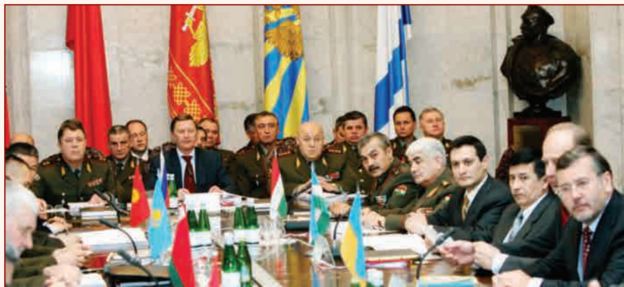
▲ Заседание СМО СНГ. Министр обороны Российской Федерации С.Б. Иванов возглавляет СМО СНГ с 2001 года

В ходе реализации концепции военного сотрудничества успешно совершенствуется объединенная система ПВО государств — участников СНГ.