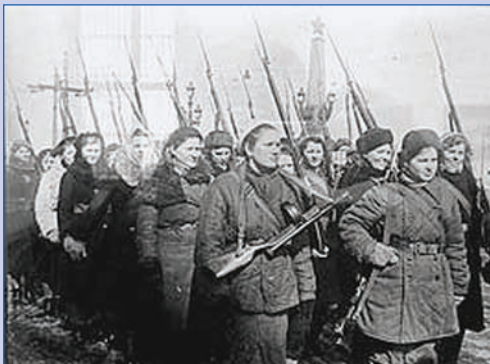
Фото В. ТАРАСЕВИЧА, октябрь 1941 г.