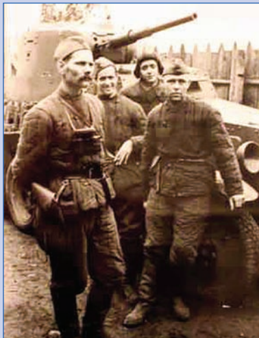
Фото В. КАПУСТИНА, апрель 1942 г.

Ленинградский фронт. Гвардейцы — саперы подразделения гвардии капитана Михеева выдвигаются для минирования танкоопасной местности