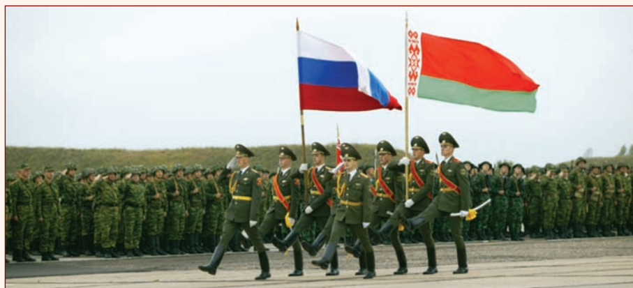
▶ Торжественное открытие совместных учений Вооруженных сил Российской Федерации и Республики Беларусь