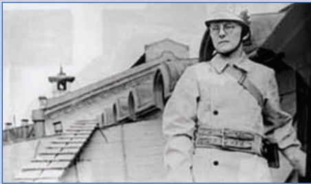
сентябрь 1941 г.

▲ Композитор Дмитрий Шостакович — боец противовоздушной обороны