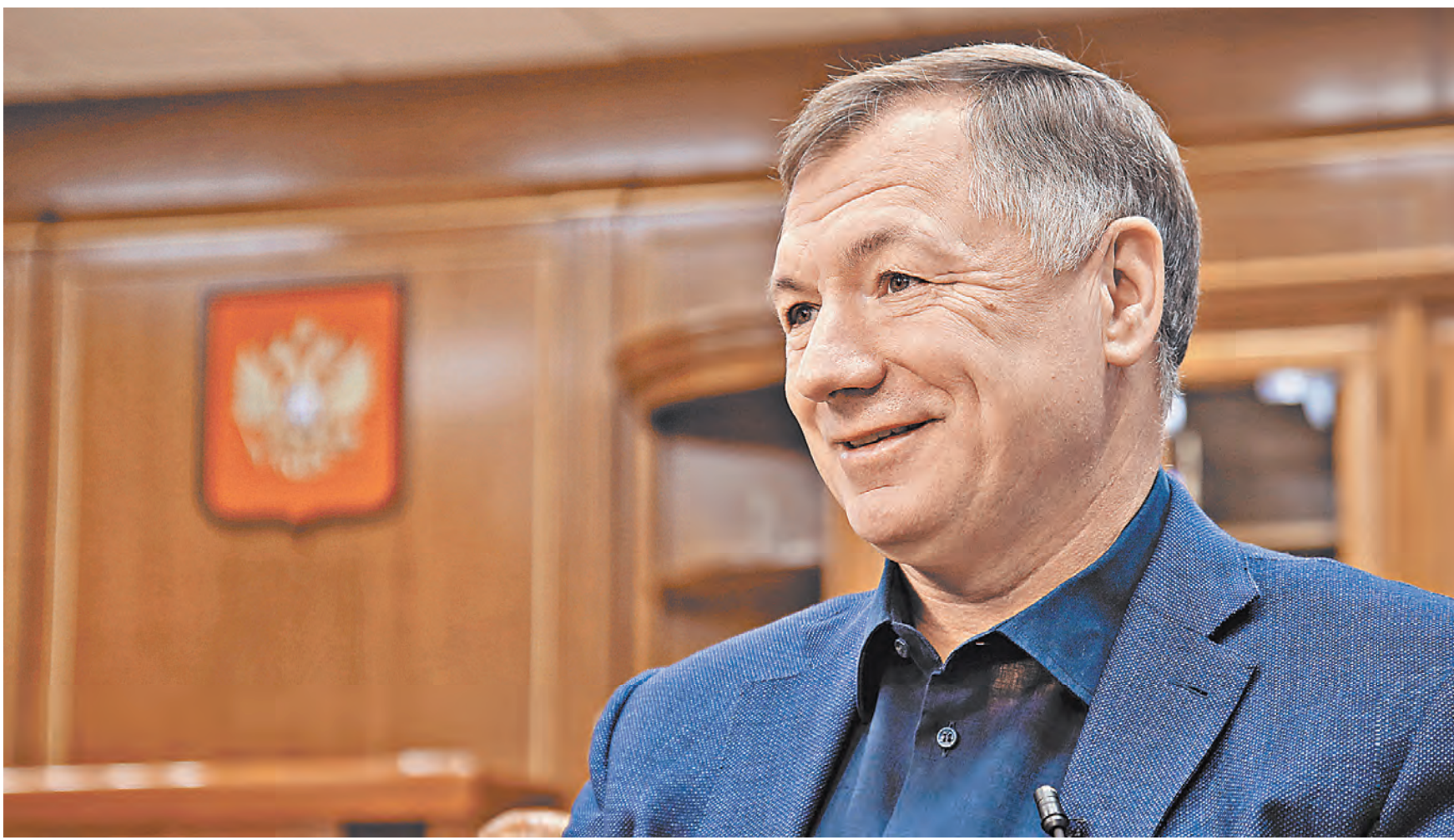
АПАТАН ВИЦЕ-ПРЕМЬЕРА МАРАТА ХУСНУЛЛИНА