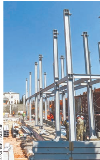
Сейчас на стройке монтируют колонны металлокаркаса.

— Мы полностью перепрофилировали городскую инфекционную больницу под