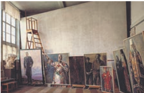
Мастерская Павла Корина с полотном и эскизами — главным трудом жизни художника «Русь уходящая».

Замысел «Руси уходящей» возник у Корина в марте 1925 года на похоронах патриарха Тихона — духовного лидера, жертвы советского