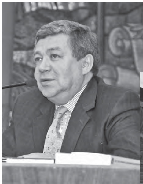
Директор Института экономики РАН, член-корреспондент РАН Р.С. Гринберг