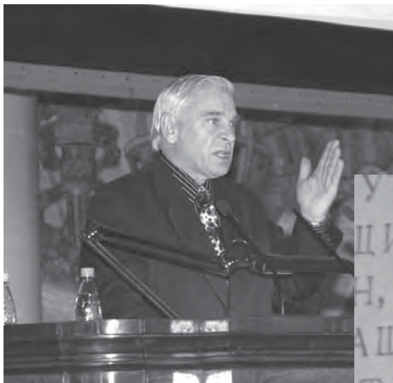
Директор Института экономики Уральского отделения РАН, академик РАН А.И. Татаркин