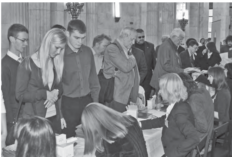
Участники Экономического собрания