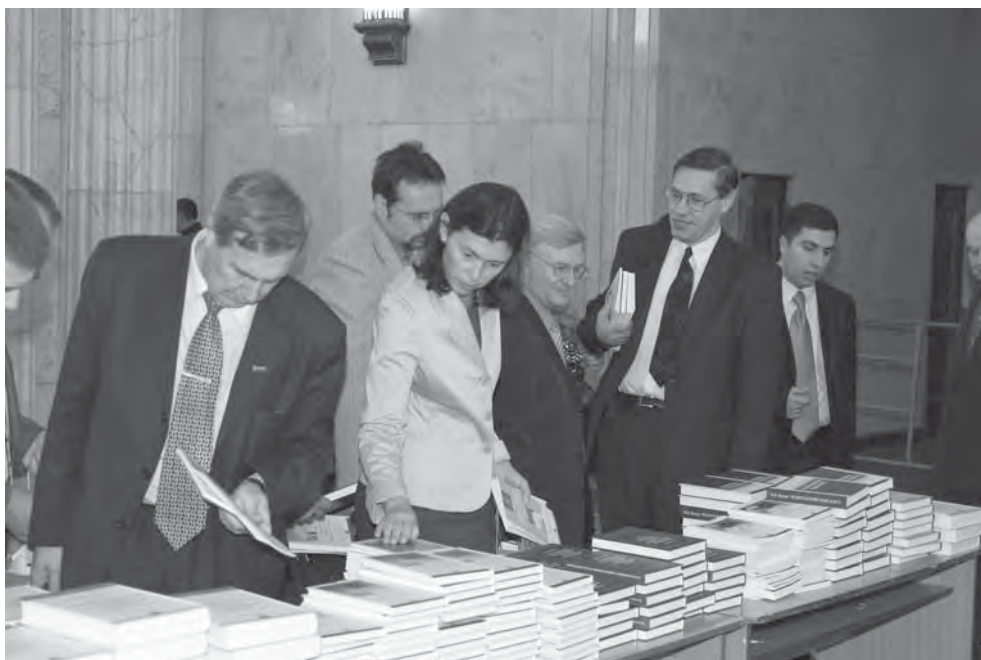
Презентация книг Центра проблемного анализа и государственно-управленческого проектирования