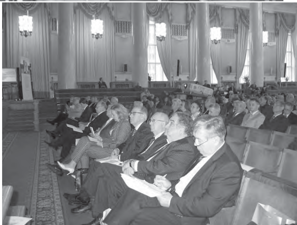
Большой зал МГУ. Участники пленарного заседания