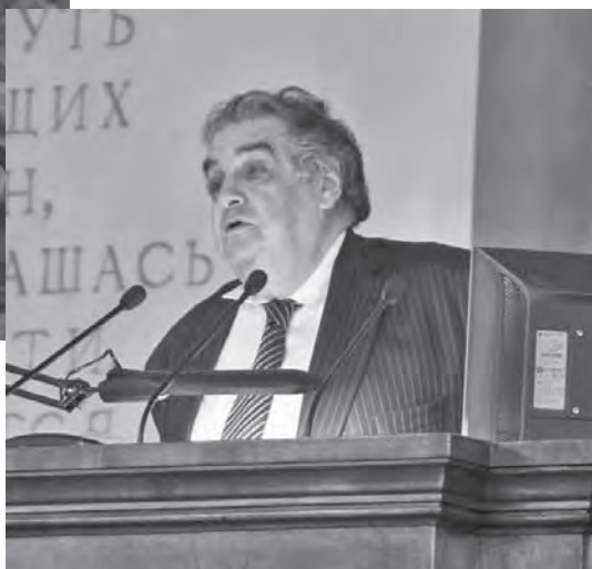
Академик РАН А.Г. Аганбегян