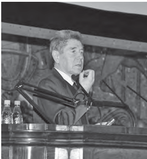
Академик РАН, академик-секретарь Отделения общественных наук РАН В.Л. Макаров