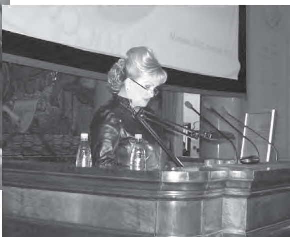
Первый заместитель Председателя Госдумы РФ Л.К. Слиски