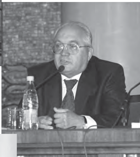
Академик РАН, ректор Московского государственного уни- верситета им. М.В. Ломоносова В.А. Садовничий