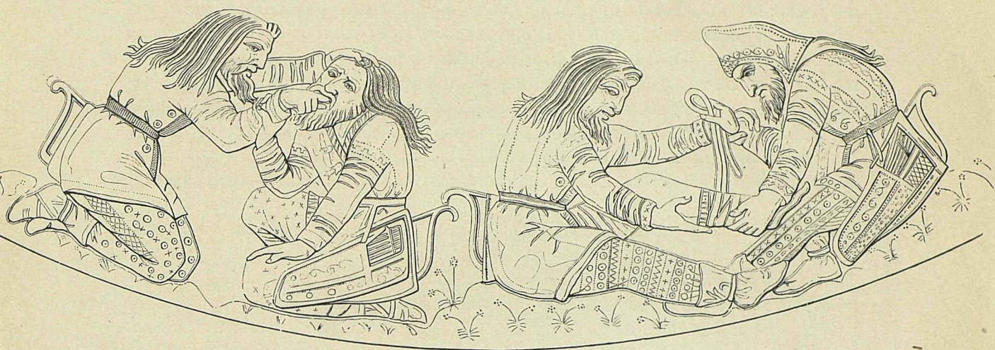
1. Группа Скифовъ на вазѣ изъ Куль-Обскаго кургана.

Отъ самыхъ склоновъ Памира, тамъ, гдѣ выходятъ изъ горъ рѣки Оксъ (Аму-Дарья) и Яксартъ (Сыръ-Дарья), беретъ свое начало широкая степь, связывающая, поверхъ Каспійскаго моря, Азію съ Европою. Связь эта по физическому строенію страны настолько полная, что нельзя бы было провести опредѣленной границы между двумя частями свѣта. Повсюду та-же равнина, то затянутая глиною, то засыпанная пескомъ, изрѣдка прерываемая холмистыми кряжами, солончаками, болотами. Русскій естествоиспытатель Сѣверцовъ выразилъ мнѣніе, что флора Южной Россіи простирается до бассейна Енисея. То-же распространеніе имѣла въ древности фауна южно-русскихъ степей. Еще въ XVII вѣкѣ водились въ Украинѣ туръ, кабанъ и дикіе кони.