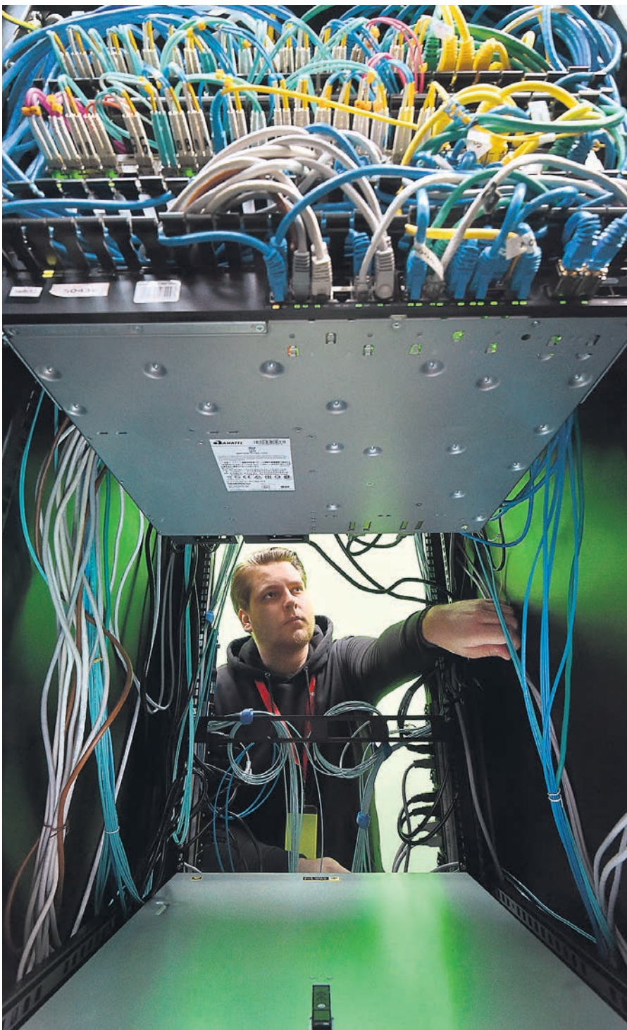
Запутавшиеся в санкциях поставки оборудования для ЦОДов могут вынудить государство заняться «переиспользованием» частных ресурсов

Собеседник „Ъ“ на IT-рынке объясняет, что из-за ухода зарубежных облачных сервисов, которые в том числе использовали некоторые ведомства, спрос в серверных мощностях «моментально вырос». Ситуация осложняется тем, что цены на китайское оборудование увеличились в несколько раз, логистика нарушена, а заказчики зарубежной техники, которая уже ввезена в Россию, в ряде случаев не могут забрать ее со складов, говорят собеседники „Ъ“. «В страну ввезли две фуры серверов зарубежного вендора, но выдавать нам их отказываются, ссылаясь на санкции», — говорит собеседник „Ъ“ в крупной IT-компании. Другой собеседник „Ъ“ утверждает, что Hуа-