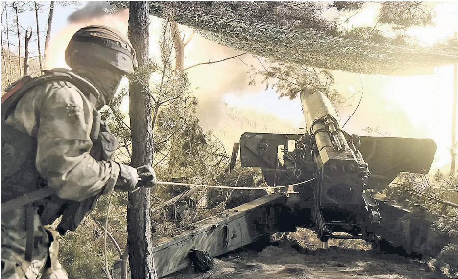
Александр ТИХОНОВ ★

Господство наших войск в воздухе, подавляющее преимущество в высокоточном оружии большой дальности и в боеспособности частей и соединений обрекают противника на неизбежное поражение