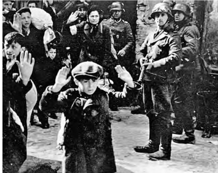
Слова директора ФБР прозвучали akurat к 72-й годовщине восстания в варшавском гетто, которое было жестоко подавлено войсками вермахта.

15 апреля директор ФБР посетил Музей Холокоста в Вашингтоне. Там он выступил с речью, в которой обвинил своих сотрудников приходить в этот музей, чтобы увидеть, как «хорошие люди помогали убивать миллионы», поднимая идеологию нацистов. «В своем сознании убийцы и их пособники в Германии, Польше, Венгрии и многих-многих других местах не делали ничего ужасного. Они убедили себя в том, что