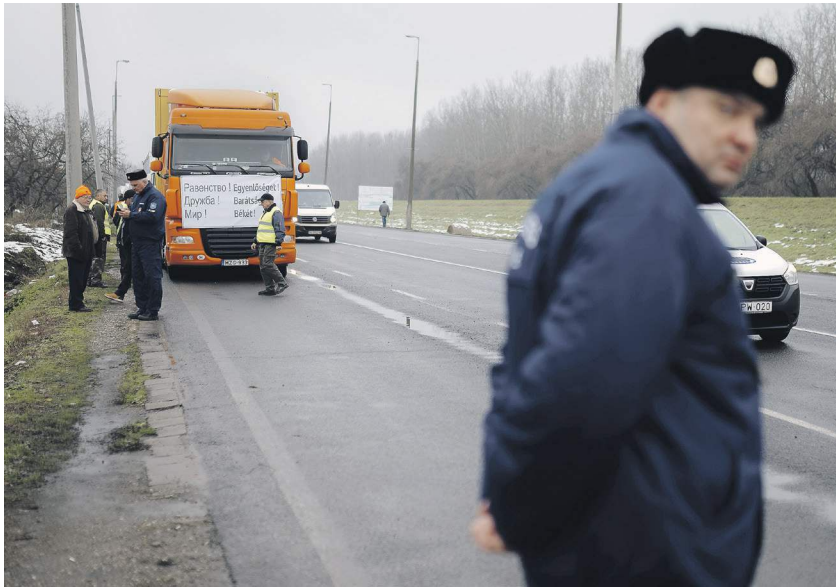
Акция протеста венгерских дальнобойщиков началась в Захоне 11 декабря