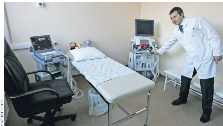
РДКБ предоставила для наблюдения за тяжелобольными детьми самое современное оборудование.