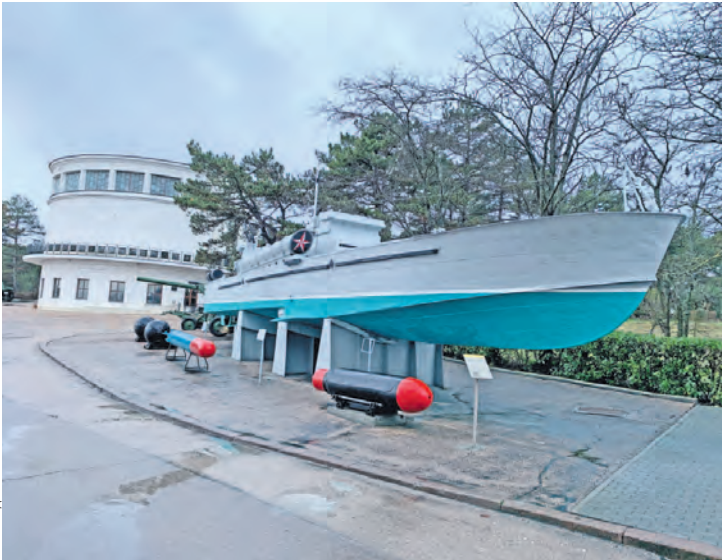
Экспонаты обновляют к 75-летию освобождения Севастополя от фашистов.