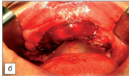
Рис. 2. Та же больная.

Послеоперационный дефект после иссечения новообразования и удаления зубов (а) закрыт силиконовой мембраной, которая зафиксирована непрерывным швом (б).