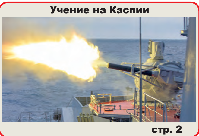
Учение на Каспии