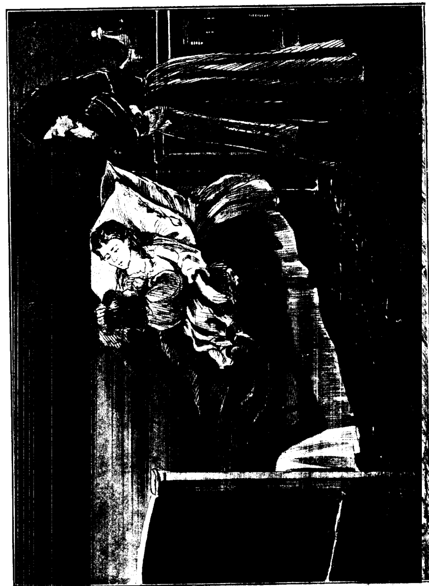
Мамочка была очень слаба и худа...

А по праздникамъ, когда мама не уходила на службу, мы цѣлый день были неразлучны... Утромъ ходили въ церковь, а послѣ завтрака долго гуляли,