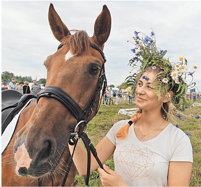
«Купалье» в Александрии стало своеобразным культурным мостом, соединяющим народы Беларуси и России.

В этом году в концепцию праздника организаторы феста также вписали работу символического «Города дружбы», включающего три широкие ярмарочные улицы: Минскую, Московскую и Киевскую — эти названия говорят о географии «сябро» Александрии.