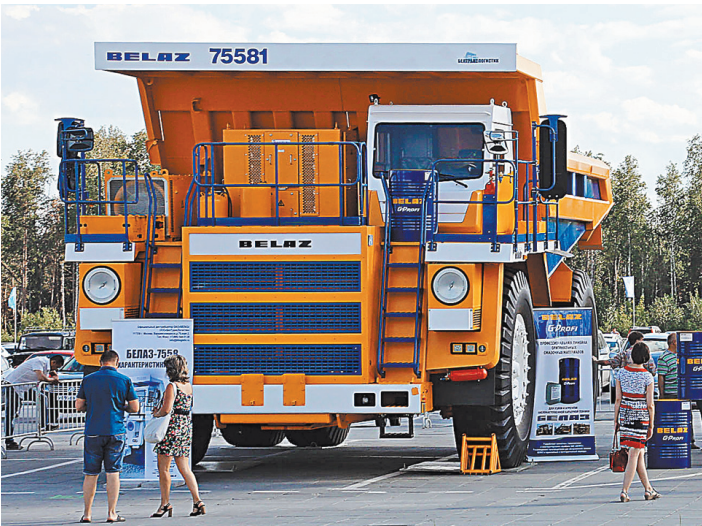
Уралцы по достоинству оценили БелАЗы.