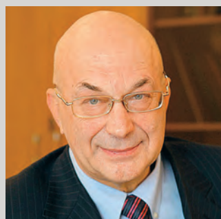
ПРЕДСЕДАТЕЛЬНО ПРЕСС-СЛУЖБЫ СОУ