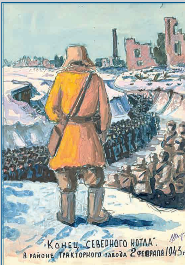
Конец Северного котла