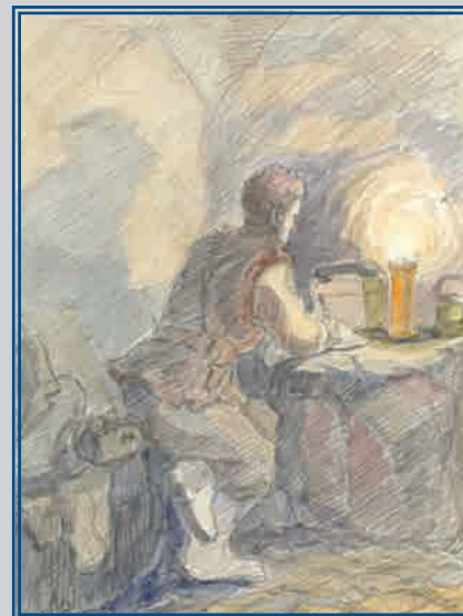
Блиндаж штаба дивизии