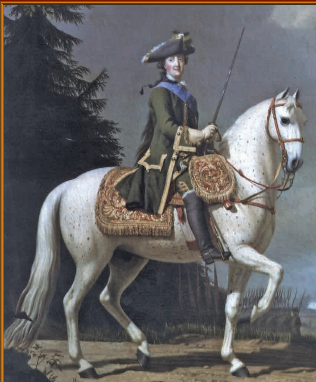
Екатерина II Алексеевна Художник В. Эриксен, 1762 г. Государственный Русский музей

300 лет назад, 15 (4 по ст. ст.) июля 1710 года, после длительной осады русские войска взяли крепость Ригу