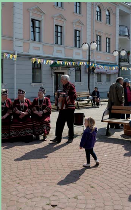
На золотой набережной