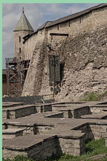
Кремль Довмонтов город