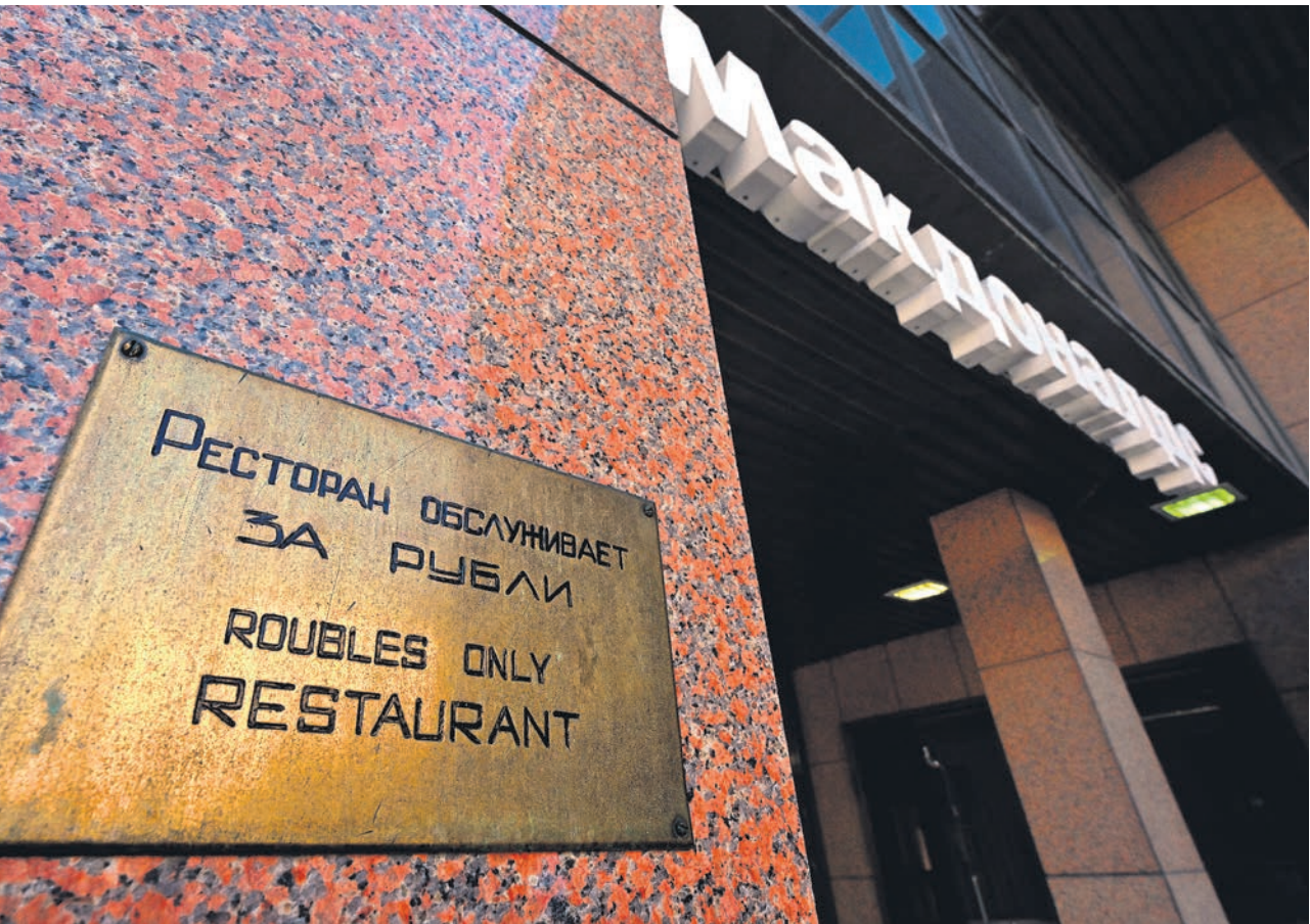
Временная схема работы в России иностранных компаний, приостановивших работу, получает законодательное оформление

Как стало известно, «Б», завершена разработка законопроекта «О внешней администрации» — предполагаемое решение проблемы приостановки работы в РФ иностранных компаний. Напомним, дискуссия о том, как ее решать, возникла сразу после массового (сейчас более тысячи компаний) отказа дочер-