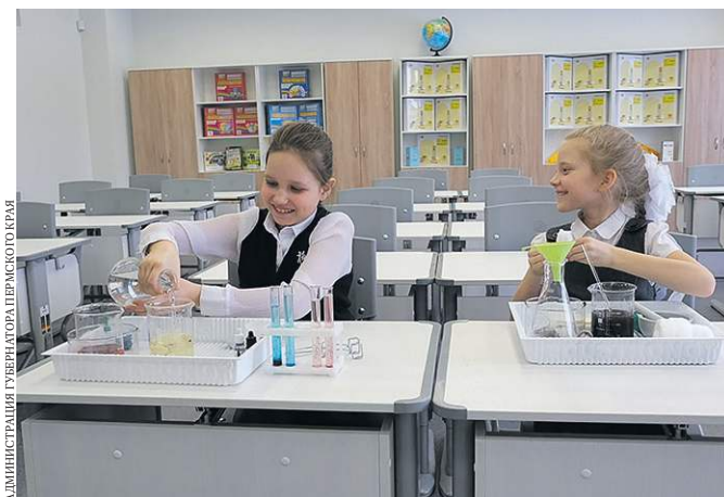
В Пермском крае уже открыты медицинские классы, оборудованные на средства краевого бюджета.