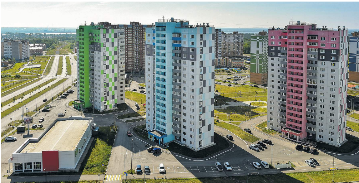
На правобережной части Березников завершено строительство последнего из 29 домов жилого комплекса «Любимов». Квартыры в них предназначены для переселения граждан, чье жилье оказалось в зоне техногенной аварии.