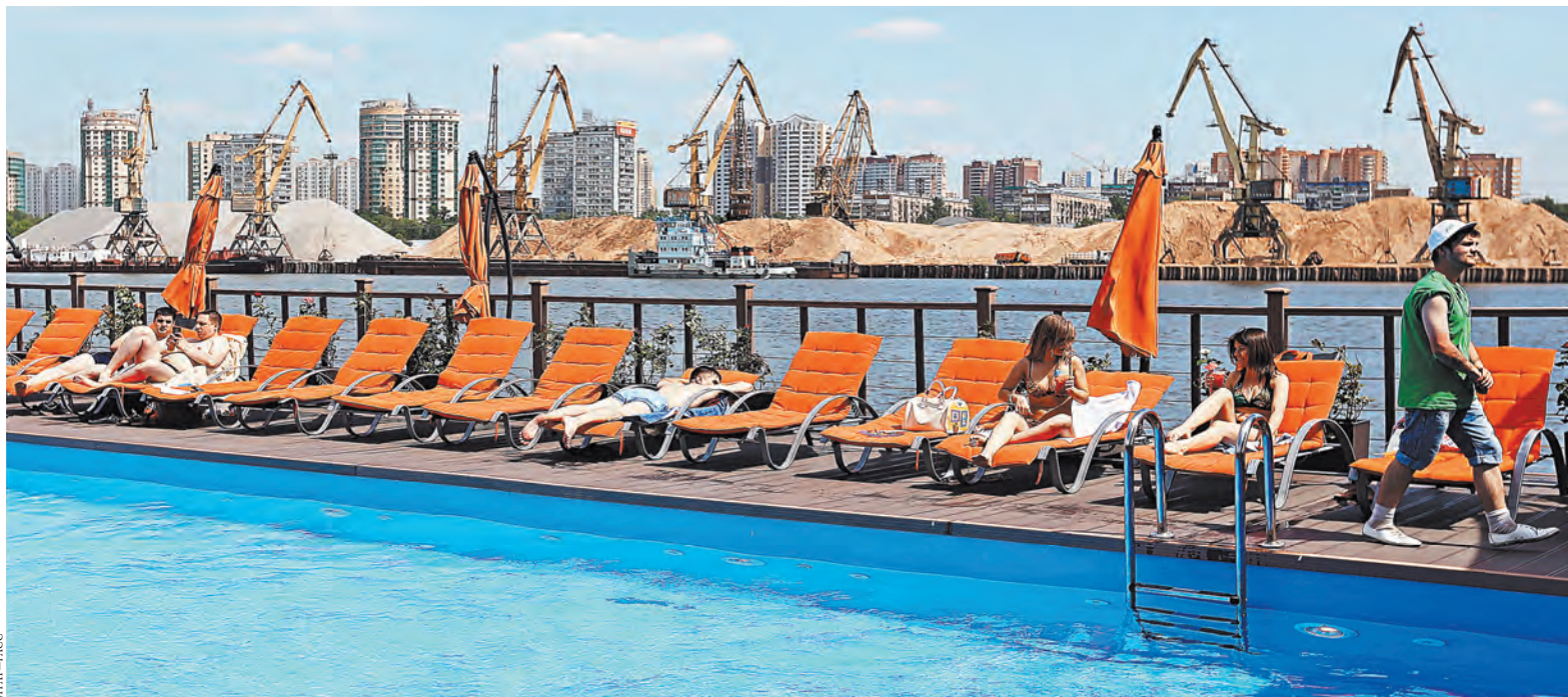
Москва, 4 июня. Отдыхающие у бассейна Pantop в парке Северное Тушино.

Аномально теплой весна-2014 стала и для большей части Европы, Ближнего и Среднего Востока, Северной Африки, Китая и Индокитая. А вот на большей части США и Канады было заметно холоднее обычного (на 1–3 °C).