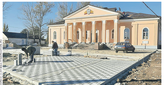
Дом культуры похож на дворец. И вокруг него тоже станет красиво.